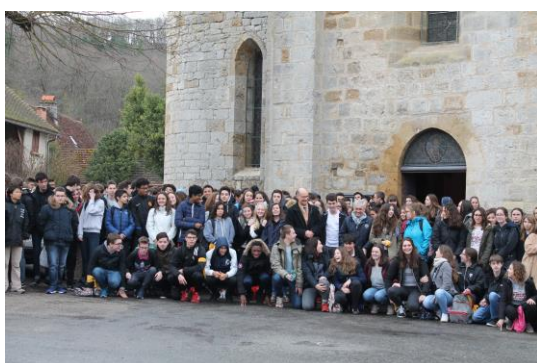
Elèves de Seconde d'Edmond Michelet