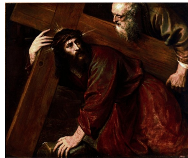
Peinture de Titien (Tiziano Vecellio) (1485-1576)

De l'Évangile selon Saint Luc (Lc 23,26) « Quand ils l'emmenèrent, ils mirent la main sur un certain Simon de Cyrène qui revenait des champs, et le chargèrent de la croix pour la porter derrière Jésus. »